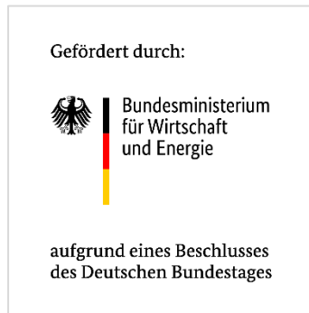
Abbildung 5: Die Bildwortmarke des Bundesministeriums für Wirtschaft und Energie – immer mit dem Zusatz „Gefördert durch:“

Die Bildwortmarke des BMWE darf von Ihnen nur in der hier dokumentierten Version („Gefördert durch“) verwendet werden. Das Logo des Bundeswirtschaftsministeriums ohne den Zusatz „Gefördert durch“ darf nicht verwendet werden.